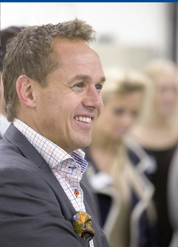
Bilder från en trevlig näringslivsträff på ITAB